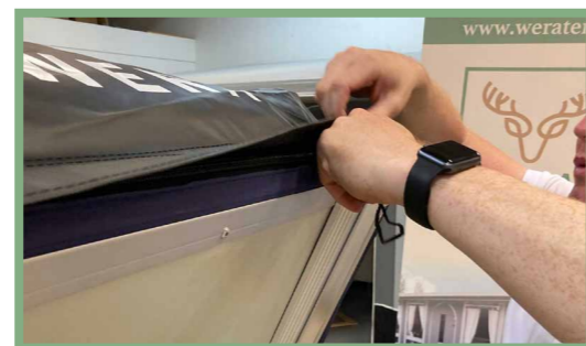
14, Trä överdraget över taktältet. Dra sedan dragkedjan runt tältet för att stänga. Spänn sedan fast remmarna med kardborrespännen.