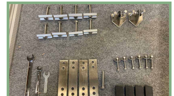
6, Brickor, skruvar, verktyg och muttrar upplagda innan monteringen kan starta.