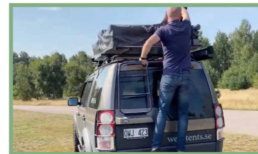
19, Ta loss dragkedjan genom att föra den runt tältet. Anlägsna därefter höljet genom att dra överdraget ut genom spåret.