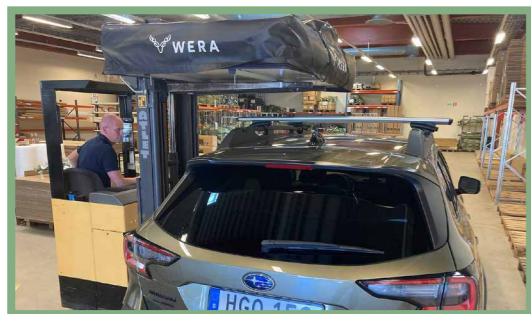
16, Lyft taktältet på plats på bilens taktäcke. På bilden använder vi en truck, men det går även bra att lyfta för hand.