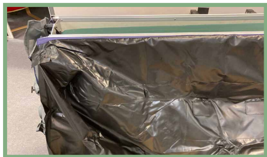
13, Förbered det skyddande höljets överdrag genom att föra in det i avsedd skena.