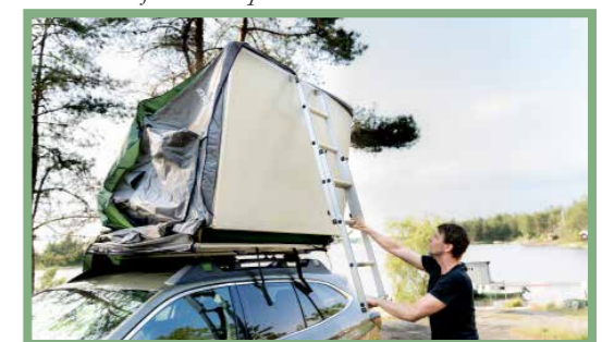
20, Ta ett stadigt tag om stegen och dra den mot dig för att veckla ut taktältet.