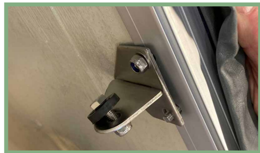
11, Fäst beslaget för stegen i skruvarna med sex millimeters mutter.