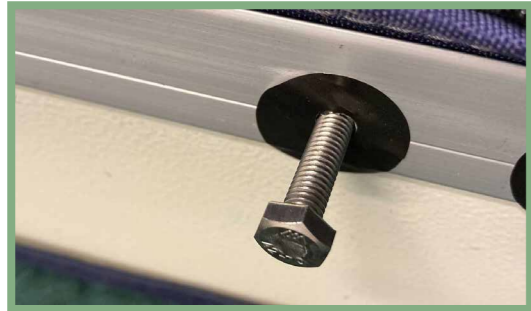
9, Förbered monteringen av stegen genom att trycka genom fyra sex millimeters skruvar på anvisade platser. Hålen markeras med fyra svarta tejpstycken.