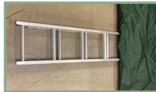
12, Fäst stegen i beslagen och skruva åt ordentligt.