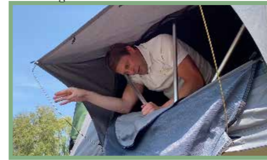
23, För att hålla fönsterklaffarna på plats fästs stöttepinnarna i hålen som finns ut utsidan av taktältet medan kroken fästs i ögglan på utsticket. Observera att pinnarna förs in snett i hålen.