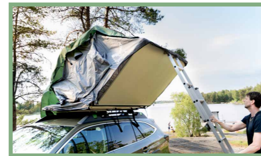
21, Dra stegen mot marken och låt den stå med lätt lutande vinkel. Stegen blir en del av den bärande konstruktionen när de fjädrande låsspärrarna avger ett klickande ljud och låser stegen.