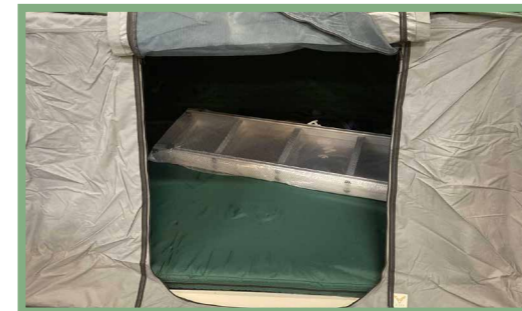
3, Genom att öppna taktältet finner du ytterligare medföljande delar, som exempelvis steg och överdrag.