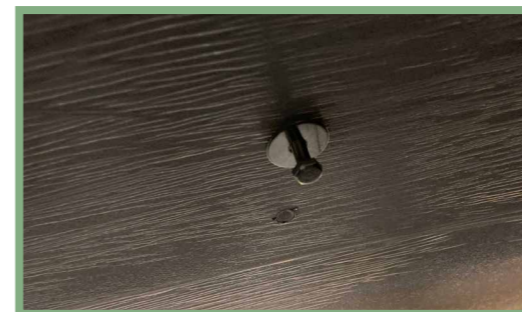
7, Klättra in i taktältet och placera fyra brickor med sex millimeter skruv i de förborrade hålen, montera fästräcket på utsidan med en sex millimeters bult med hjälp av medföljande 10 millimeters nyckel. Se till att skruven är ordentligt åtdragen från insidan.