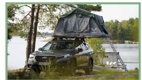
22, När taktältet är utfällt är det dags att öppna myggnät och fönsterklaffar.