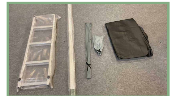
4, Lägg ut samtliga medföljande delar på marken. Sammanlagt är det fem medföljande delar. En steg, två fästskenor, en påse med stötpinnar, påsar med skruvar, verktyg och fästbrickor samt ett överdrag.