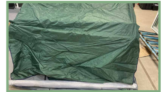
2, Fäll upp tältet och lägg ut medföljande delar inför monteringen.