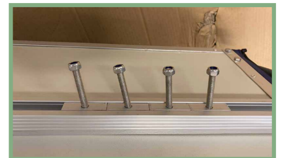
8, När fästskenor monterats, placera fyra glidbrickor per skena med åtta millimeters skruv i glidrännan från sidan av fästet för taktältet. Dessa kommer att hålla fast de fyra monteringsplattorna runt bilens takskenor. Montera därefter medföljande svarta ändpluggar på fästräckets ändar.