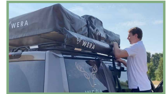
18, Börja med att släppa på banden som är fastspända tvärs över taktältet. På så sätt kan man öppna dragkedjan som innesluter tältet. Observera att på bilden sitter även en markis som finns av köpa som tillbehör.