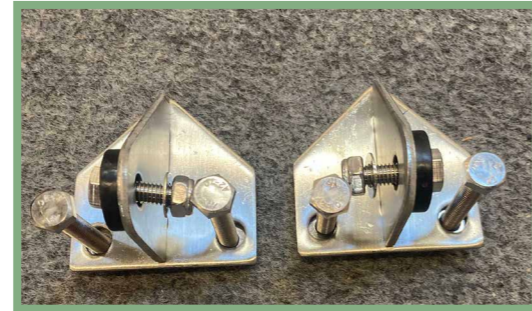
10, Förbered fästena för stegen som på bild.