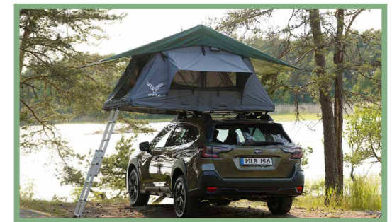
24, Nu är taktältet klart att använda. Nu är det bara att njuta! Stort hycka till!