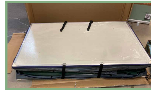
1, Starta med att ta bort emballaget runt taktältet och lägg det på ett plant och rent underlag. Lös gör remmarna som håller ihop taktältet.