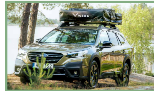
17, Taktältet monterat på takeräcket. Måtten specificeras på sida tre.